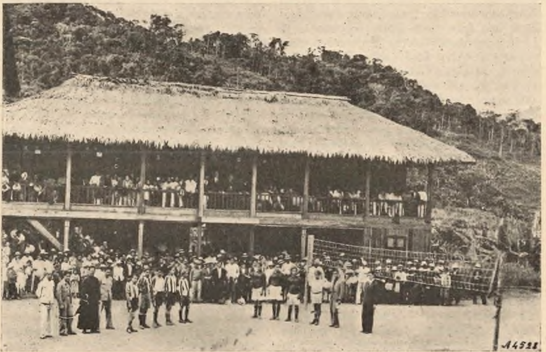
Limón. - La Missione.

giorno. I buoni coloni della Missione, preavvisati della visita di Monsignore, vollero rendergli omaggio aprendogli un nuovo sentiero per rendergli meno penoso il lungo viaggio. Vennero ad incontrare Monsignore gran parte degli uomini, mentre centinaia di persone, in maggioranza fanciulli e fanciulle, l'attende-