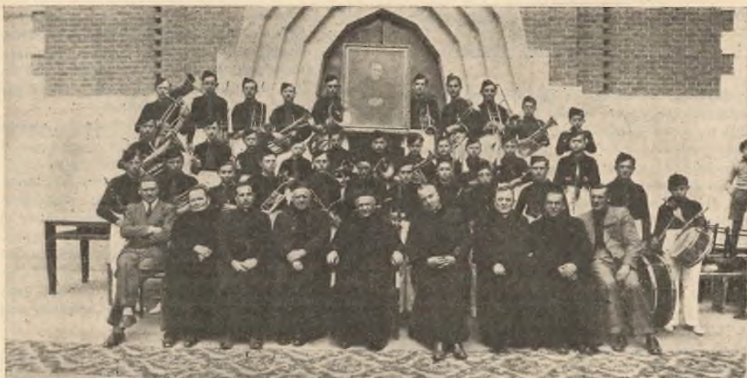
Foglizzo. - La banda dell'Oratorio salesiano benedetta dal Rettor Maggiore.