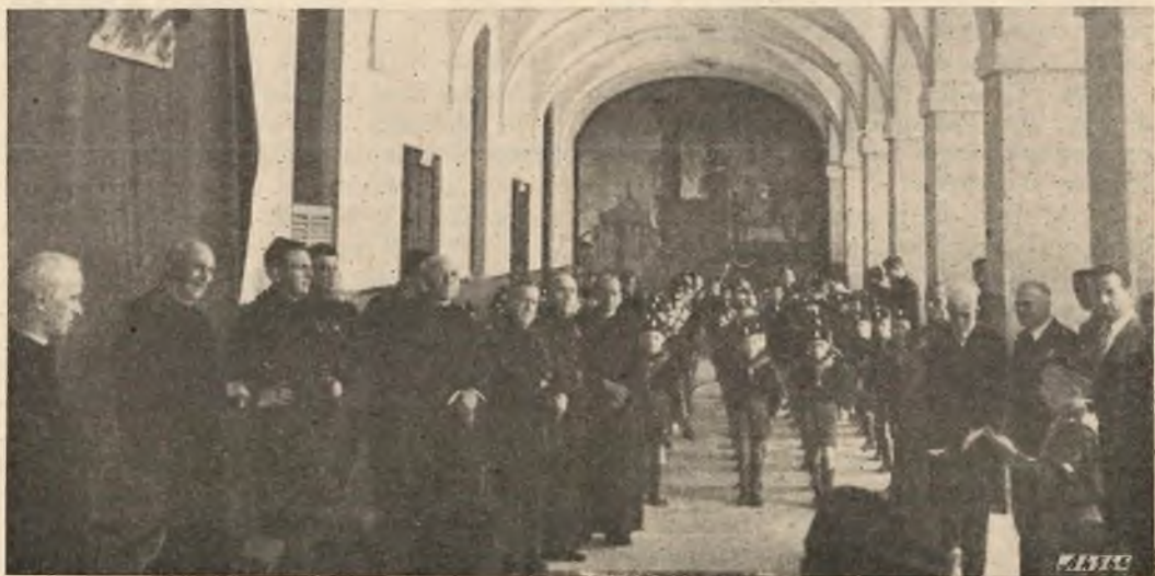
Torino. Martinetto. - S. E. Rossoni nel suo antico Collegio riceve l'omaggio degli alunni.