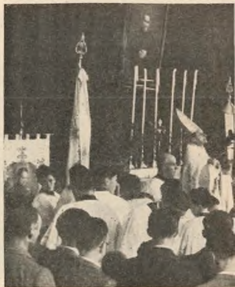
Pordenone. - S. E. Mons. Bartolomasi tiene

di avere il quarto Successore del Santo ad inaugurare e benedire i nuovi magnifici locali che, mentre rendono più bella e grandiosa la Casa, soddisfano al numero crescente dei chierici del nostro Studen-tato filosofico e alla rigogliosa fioritura del locale Oratorio festivo. I promotori vollero far rivivere col 25 aprile u. s. la giornata del 20 ottobre 1886, quando, 52 anni fa, Don Bosco si portò per la prima volta a Foglizzo per dare inizio all'Opera salesiana. Sul medesimo piazzale, pressochè alla medesima ora, dove e quando venne accolto il Santo, fu ricevuto il suo quarto successore Don Pietro Ricaldone. Nella entusiastica accoglienza che egli ebbe vi-