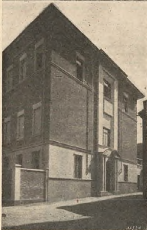
Foglizzo. - Ingresso ai nuovi locali dell'Oratorio festivo.

Foglizzo Canavese. — La Casa di Foglizzo, una delle ultime fondazioni di Don Bosco vivente, resta negli annali della Società Salesiana quale una preziosa reliquia che il Santo legò alle sollecite cure del suo primo successore, Don Michele Rua. Casa di formazione religiosa per i nostri chierici, essa è anche, come la intese il Fondatore, centro di azione cattolica per la popolazione del paese. La celebrazione del 50° anniversario della morte di S. Giovanni Bosco fu quindi una festa per tutto il paese, fiero