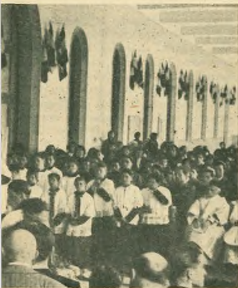
ico di S. Giovanni Bosco nel nostro Istituto.