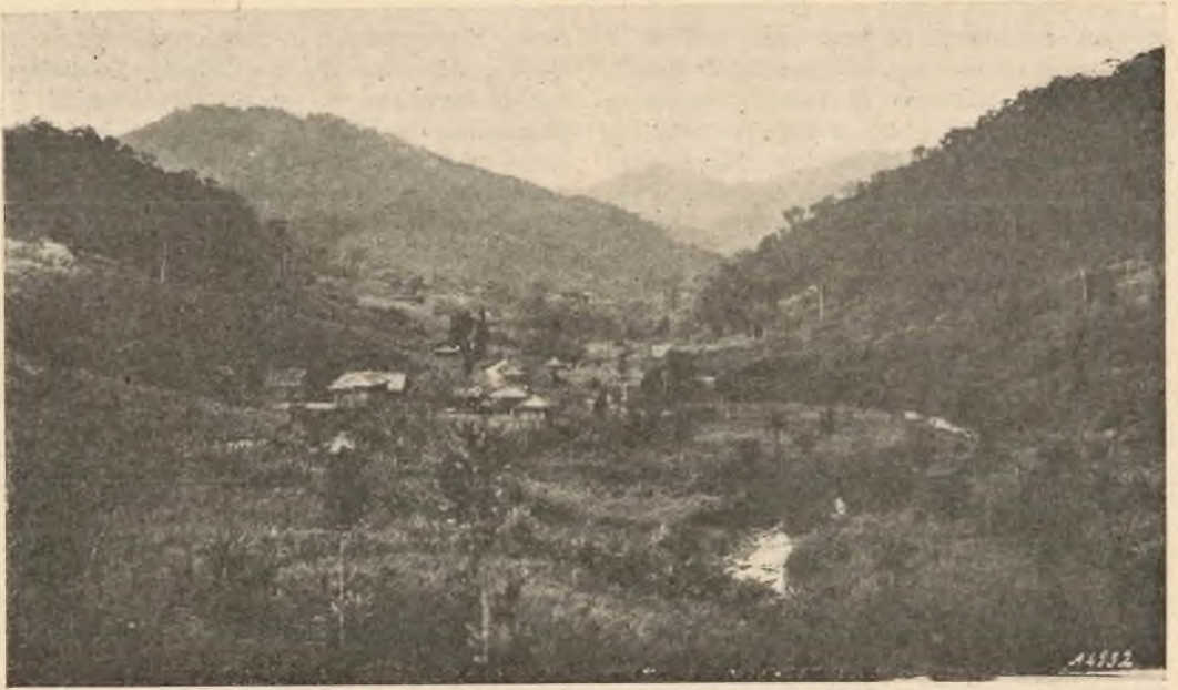
Limón. - Panorama della Missione.

DA LIMÒN A INDANZA. — Il giorno 24, commemorazione di Maria Ausiliatrice, colla consolazione di un concorso numerosissimo di fedeli alla chiesa ed ai SS. Sacramenti della Confessione e della Comunione, ci incamminammo verso la Missione di Indanza. La pioggia diretta ci accompagnò tutto il