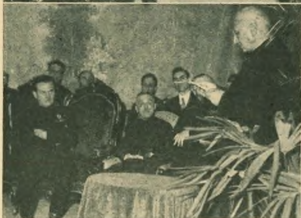
TORINO - Istantanee della visita di S. E. Rossoni: nel salone-teatro; il Ministro ascolta il discorso del Rettor Maggiore; nel cortile, di fronte al monumento di D. Bosco.