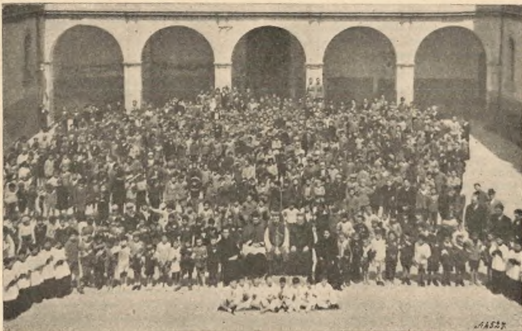
Caltagirone. - L'Oratorio salesiano.