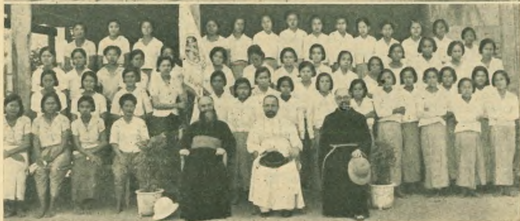
Siam. - Gruppo generale degli studenti del Collegio S. Giuseppe. — Rappresentanze dei gruppi di Azione Cattolica. — Le giovani di Azione Cattolica dopo la commemorazione di Paolina Jaricot.