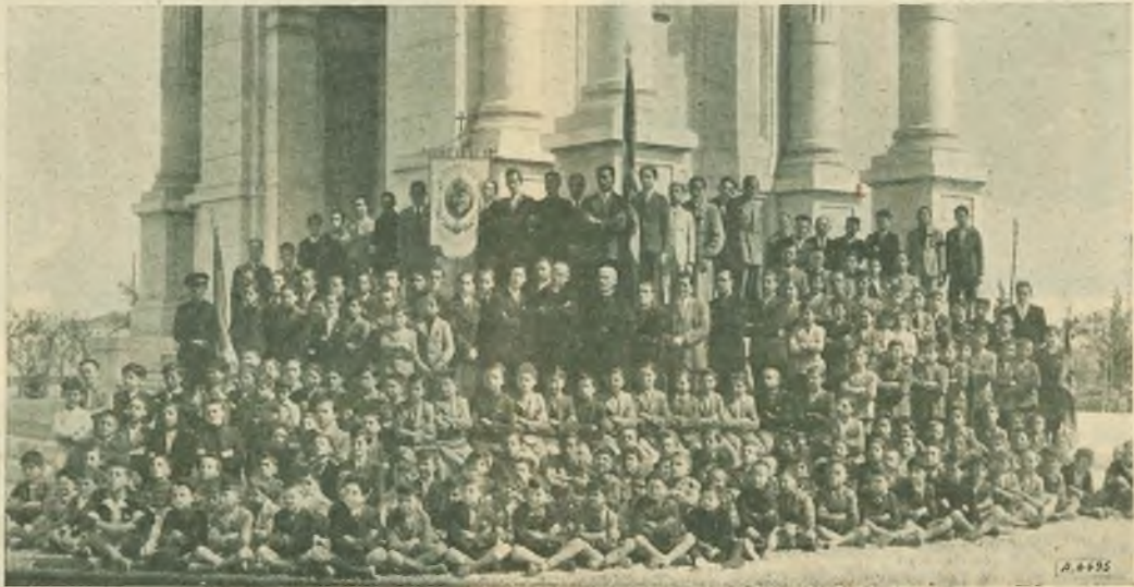
Andria. - Soci dell'Azione Cattolica e delle Compagnie religiose del nostro fiorente Oratorio festivo.

Celebrò la Messa della Comunione generale nella maestosa cattedrale Mons. Rubino. S. E. il Vescovo diocesano tenne quindi pontificale e, la sera, presiedette la processione che percorse le principali vie della città e terminò nel cortile dell'Oratorio per l'inaugurazione di un grazioso monumento a D. Bosco. Mons. Vescovo, prima d'impartire la trina benedizione col SS. Sacramento, non seppe trattenere la sua commozione e si compiacque col clero, coi Salesiani e col popolo pel magnifico spettacolo di fede e di devozione.