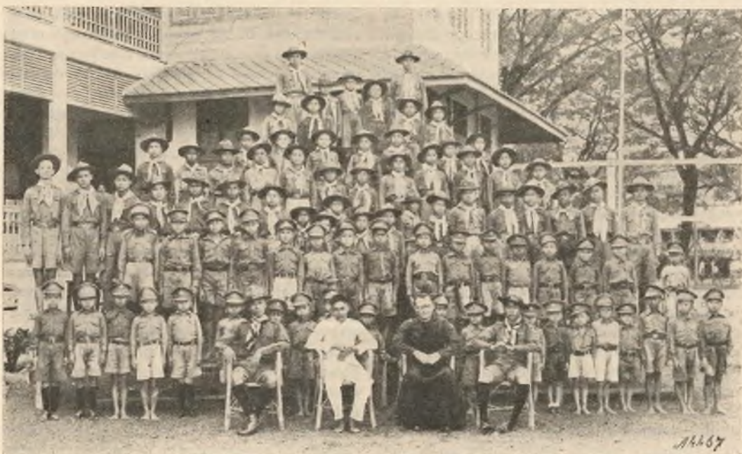
Ban Pong (Siam). - I nostri giovani esploratori.

Ma, un catechista che compia esclusivamente il lavoro evangelico deve essere ade-