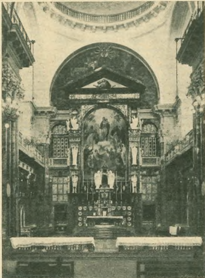
Il nuovo altar maggiore di Maria Ausiliatrice nella basilica ampliata.

Ma, dalla sua casa partì anche la sua gloria. La gloria del suo culto che, affidato dal Santo fondatore alla Società Salesiana ed all'Istituto delle Figlie di Maria Ausiliatrice, come l'eredità più preziosa, si propagò rapidamente in tutto quanto il mondo suscitando la più ardente speranza di